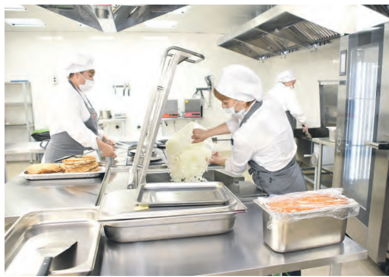
Проектная мощность нового производства — 25 тыс. единиц продукции

На предприятии используют технологию шоковой заморозки. Производство организовали на базе столовой локомотивного депо станции Новосибирск-Главный Западно-Сибирской железной дороги.