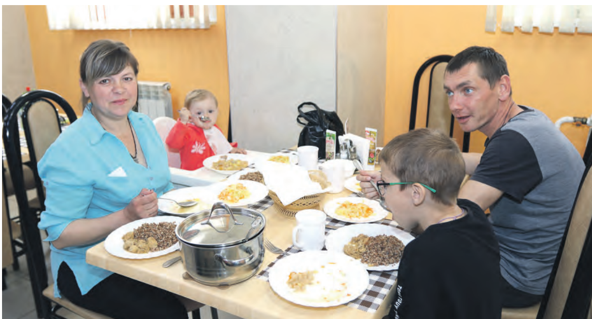
Вкусно кормят в столовой пансионата