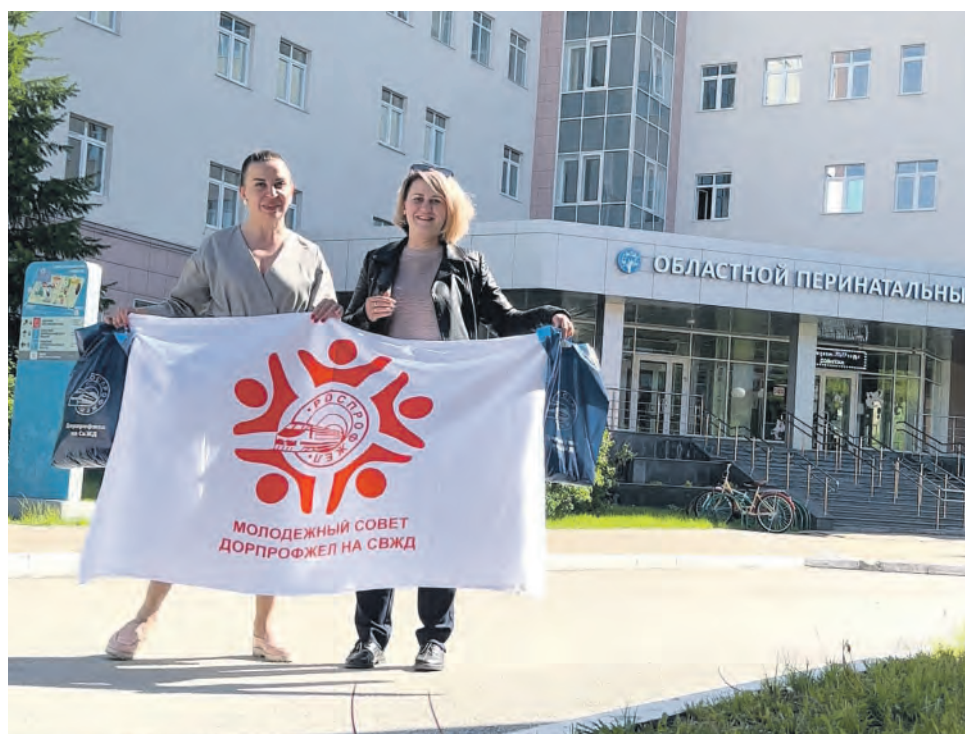
В рамках акции Молодежного совета Дорпрофжел на СвЖД «Подарим торопыжкам тепло» пациентам областного перинатального центра в Екатеринбурге передано более 100 пар носков и 50 тактильных игрушек. Изделия связаны молодыми работницами, пенсионерами СвЖД и студентами отраслевых учебных заведений