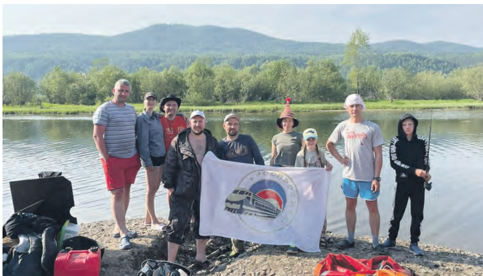
Члены профсоюза эксплуатационного локомотивного депо Красноярск-Главный открыли новый сезон сплавов по реке Мана, которые традиционно проводятся каждое лето уже более 35 лет