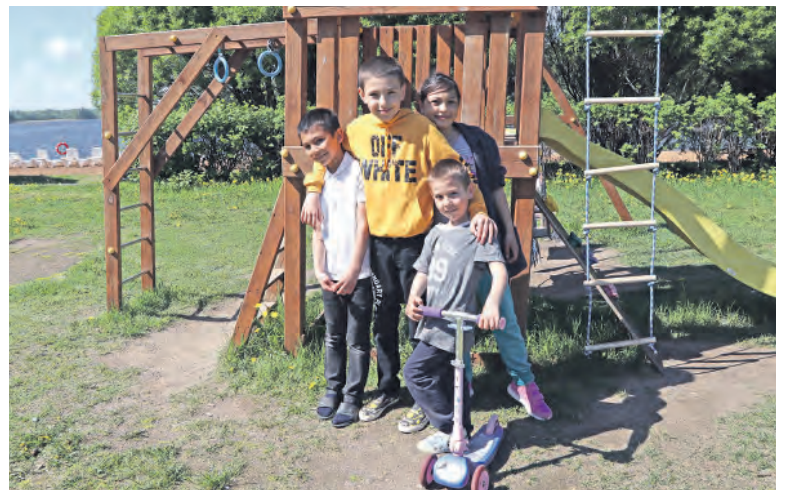
На игровой площадке