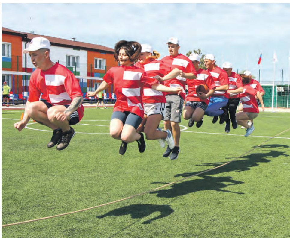
На Крымской железной дороге прошла спартакиада «Спортивные игры — 2022», в которой участвовало более 350 членов профсоюза вместе с семьями. Соревновательные дни были разбиты на несколько этапов — командное многоборье, сдача нормативов ГТО, стрелковое многоборье, командная эстафета