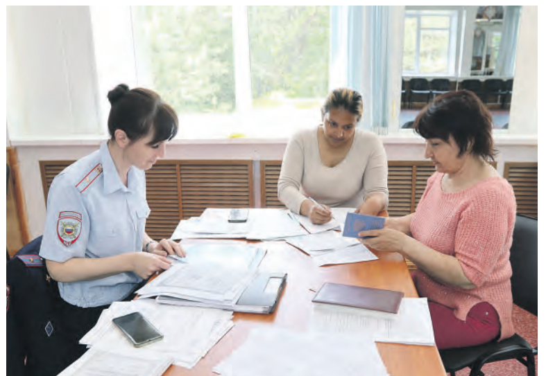
Представитель миграционной службы помогает оформить документы