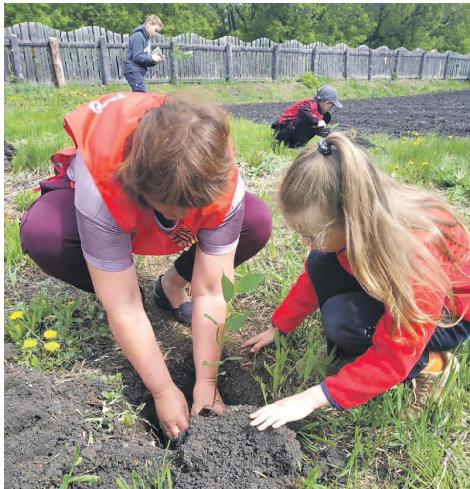
Волонтеры движения «Эстафета добрых дел» на Курганском регионе ЮУЖД посадили вместе с детьми Житниковского детского дома яблоневый сад