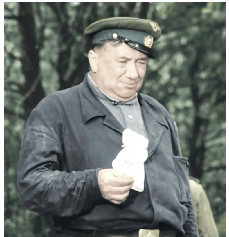
СОСТАВИЛ АЛЕКСЕЙ ПЛОХИНОВ