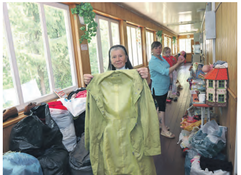
Гуманитарная помощь от Дорпрофжел на Октябрьской дороге