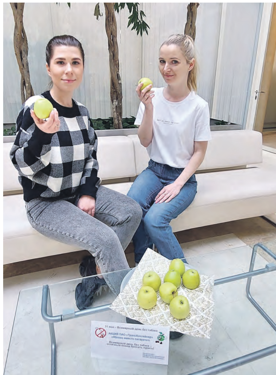
Во Всемирный день без табака первичка ПАО «ТрансКонтейнер» провела полезную акцию «Яблоко вместо сигареты!»