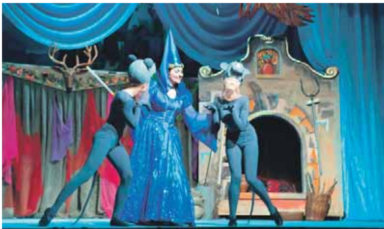
Через пару минут добрая фея превратит мышью в коней

Дети самарских связистов в возрасте до 10 лет станут зрителями новогоднего представления «Тайна ледяной лампы» во Дворце культуры железнодорожников имени Пушкина, а в Ульяновске ребята побывают на мюзикле «Снежная королева» во Дворце культуры «Губернаторский».