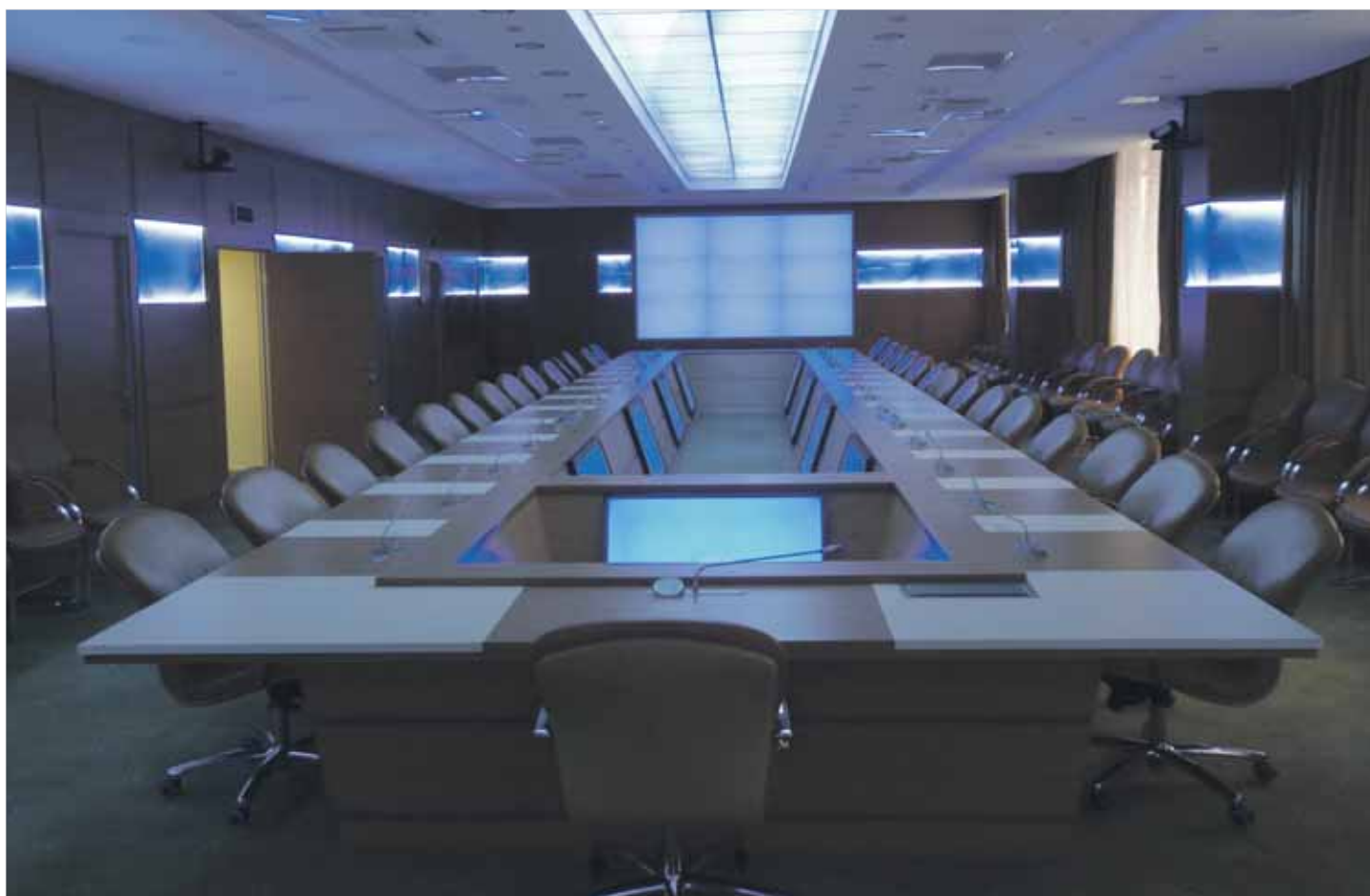
Ночных и вечерних совещаний больше не должно быть