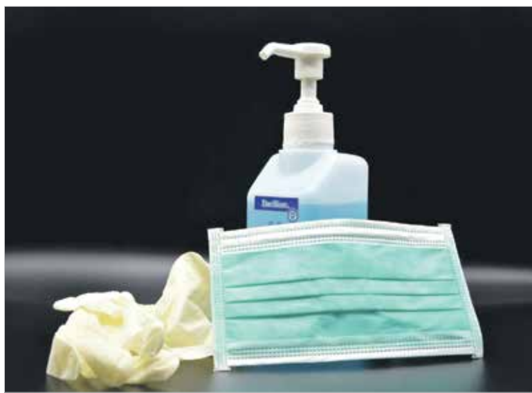
Волонтеры обеспечены средствами защиты

Кроме того, специально подготовленные волонтеры, полагают инициаторы создания отряда, более ответственно относятся к своей задаче с точки зрения соблюдения правил безопасности, чем, например, со-