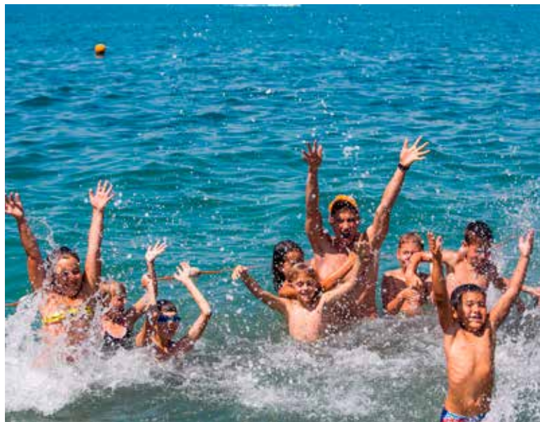
В планах следующего лета — оздоровить почти 500 детей работников КбшЖД на Черноморском побережье

«Наши работники разбирали и выносили из спальных корпусов на склад кровати, тумбочки и шкафы. Весь по-