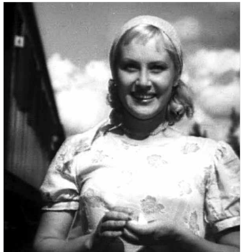
СОСТАВИЛ АЛЕКСЕЙ ТИШКУНОВ

По вертикали: Телеканал. Выручалка. Тоник. Клещ. Наушники. Есаул. Адрес. Эхо. Обвал. Исаев. Влияние. Апрель. Коала. Ерш. Служка. Пятки. Аванс. Веер. Бабочка. Консоль. Сходни. Напрон. Кринка. Радиус. Арба. Баки. Гон.