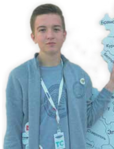
Будущего помощника машиниста поглотила общественная работа